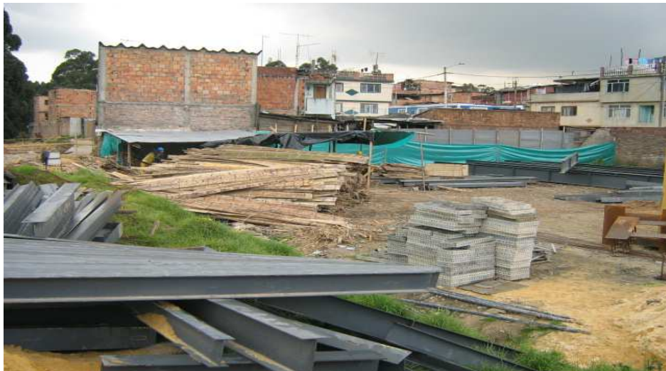
FOTO NO.1 PANORÁMICA OCCIDENTAL DEL LOTE EL RECUERDO