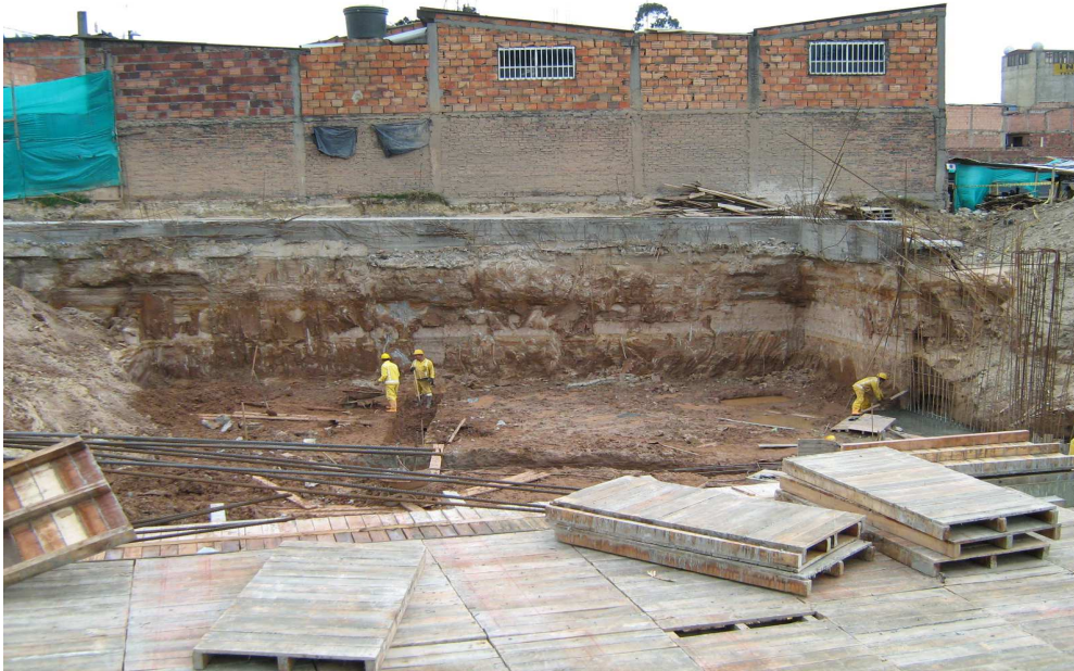
FOTO No.4 ESTADO DE LA PANTALLA DE PROTECCIÓN

En esta foto se aprecia el avance de la pantalla de protección construida por la TTSA, para lo cual fue necesario excavar 9,1 Mts. de profundidad; en tanto que la construcción del sótano de la edificación será aproximadamente de 4 Mts. de profundidad.