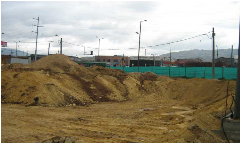
FOTO No.2 PANORÁMICA ORIENTAL DEL LOTE EL RECUERDO

En esta foto se aprecia el costado oriental del predio “El Recuerdo”, el cual a 23 de agosto de 2007 se estaba utilizando como sitio para mezclar recebo con parte del material excavado con miras a mejorar la calidad del piso.