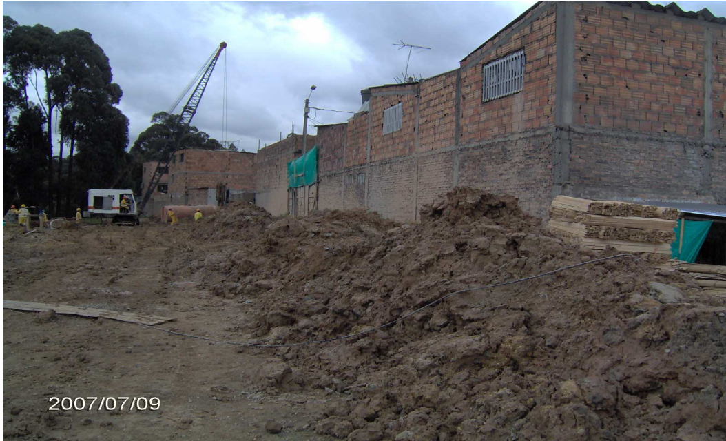
FOTO No.3 ESTADO DEL PREDIO ANTES DE LA CONSTRUCCIÓN DE LA PANTALLA DE PROTECCIÓN

En la foto anterior se aprecia como la Terminal de Transporte S.A. comenzó la remoción de tierra para la construcción de la pantalla para proteger las viviendas aledañas a la zona de la obra.